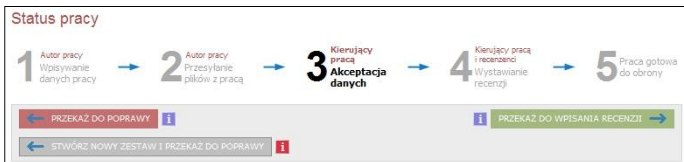
Rys. 5. Przyciski zmiany statusu na Wystawianie recenzji i przekazania pracy do poprawienia danych

W celu zaakceptowania danych i załączników, należy kliknąć przycisk PRZEKAŻ DO WPISANIA RECENZJI (rys. 5). Prace można także skierować do poprawienia danych za pomocą przycisku PRZEKAŻ DO POPRAWY . Jeżeli po cofnięciu do poprawy student w kroku 2 wstawi nowe wersje załączników, stare wersje załączników zostaną utracone.